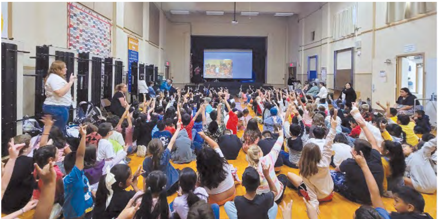
PBIS ROAR Assembly presented by our school counselor