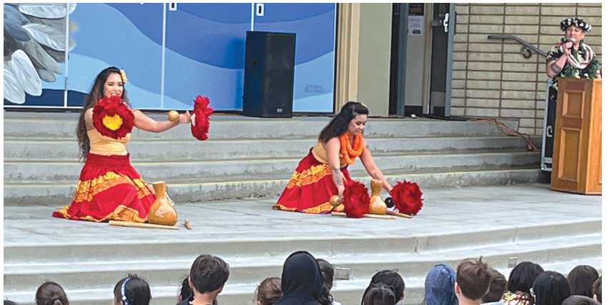
Học sinh Trường Cox thưởng thức màn trình diễn của Island Inspirations.