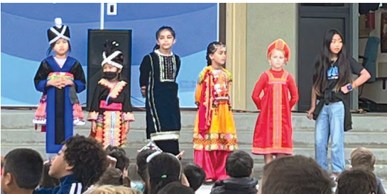
Học sinh Trường Cox thể hiện sắc phục văn hóa và trang phục truyền thống của mình trong buổi Trình diễn Thời trang.