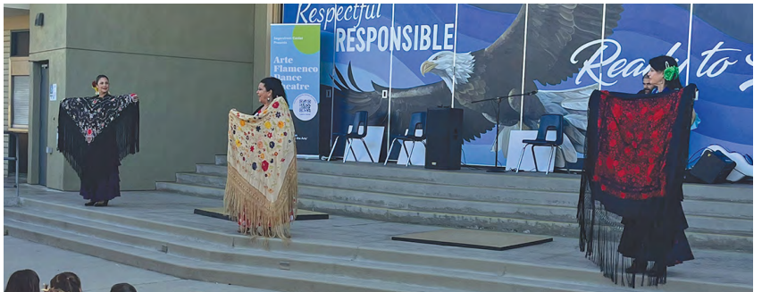
Học sinh Trường Cox thưởng thức màn trình diễn của Arte Flamenco.