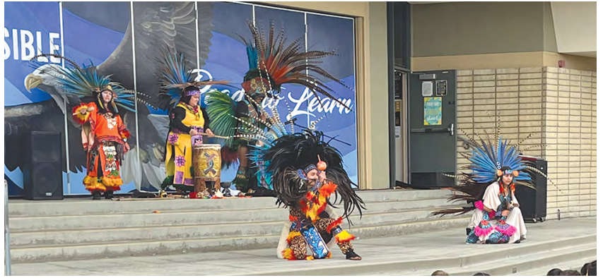
Học sinh Trường Cox thưởng thức màn trình diễn của Danza Azteca.

Lễ kỷ niệm đa văn hóa tiếp tục với các buổi tập hợp đặc biệt với sự hợp tác của Chương trình Giảng dạy Nghệ thuật từ Trung tâm Nghệ thuật Segerstrom. Những buổi tập hợp này bao gồm các buổi biểu diễn của các đoàn múa chuyên nghiệp. Danza Azteca Xochipilli thể hiện những điệu múa truyền thống của người Aztec, Island Inspirations mang đến những điệu nhảy sôi động của quần đảo Thái Bình Dương và Arte Flamenco thể hiện nghệ thuật múa Flamenco đầy thu hút. Mỗi nhóm cũng giáo dục học sinh về lịch sử và truyền thống phía sau màn biểu diễn của họ. Các học sinh đã cùng nhau tham gia khiêu vũ!