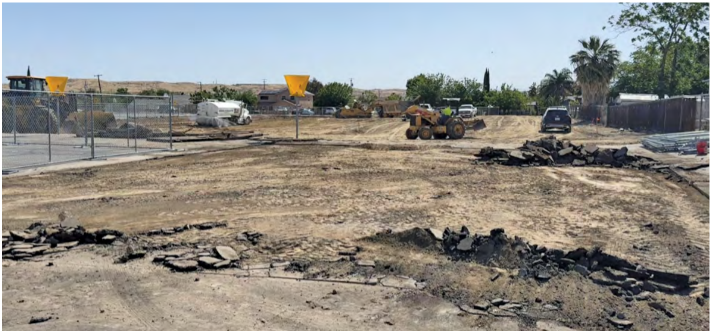
Site of the Future Jefferson School Kindergarten Complex Sitio del Futuro Complejo de Kindergarten en la Escuela Jefferson

Los proyectos se centrarán en garantizar espacio adecuado para nuestra creciente población estudiantil, así como actualizaciones de las instalaciones más antiguas del Distrito. Debido a una combinación de inscripción en constante aumento junto con la expansión de la elegibilidad para el Kindergarten de transición en California, Taft City construirá doce salones de clase para el Kindergarten de transición en sus cuatro escuelas de Kinder -3 grado. La construcción ya comenzó en la escuela Jefferson en un área que eventualmente incluirá seis salones de clases, juegos infantiles y estructuras de sombra, así como una área donde los padres pueden dejar a los estudiantes. Los planes para las escuelas Conley, Parkview y Taft Primary actualmente se encuentran en el proceso de aprobación del Estado. Se espera que los salones de clases estén listos antes del comienzo del año escolar 2025/2026. Además, las escuelas más antiguas de Taft City, Lincoln Junior High y Conley School, recibirán modernizaciones completas. Las modernizaciones se centrarán en garantizar que las instalaciones estén actualizadas según los estándares modernos y en buen estado. Se ha contratado a dos arquitectos para este propósito y ambos proyectos se encuentran en su fase inicial de diseño. Los proyectos han sido posibles gracias a una combinación de ayuda federal por el COVID, los ingresos de los bonos de la Medida C, el Fondo de Instalaciones Estatales, y las reservas de Taft City.