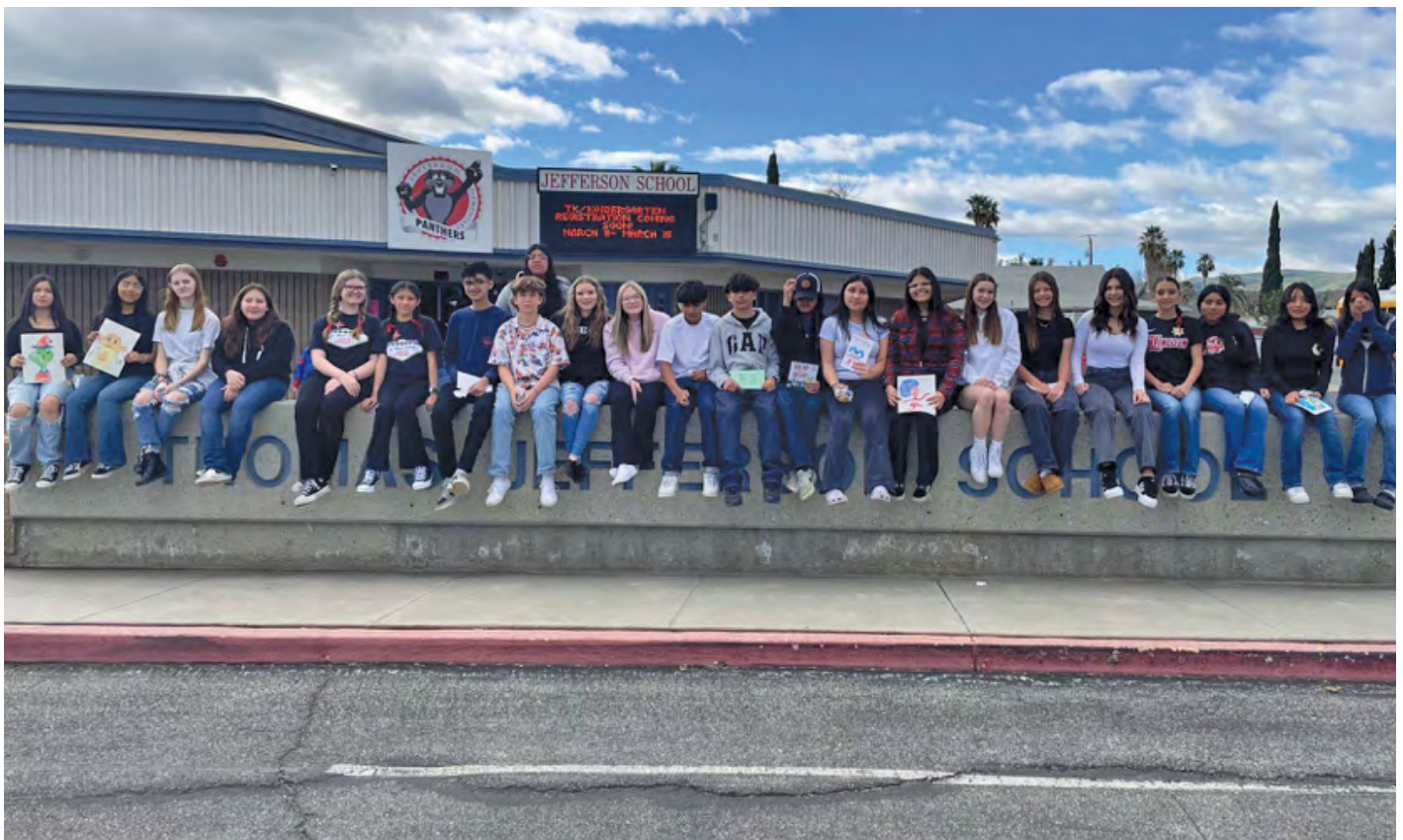
Lincoln Leadership and AVID students participating in Read Across America by reading to elementary students