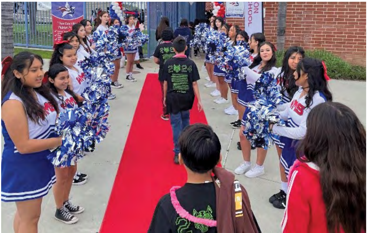
Feeder School Tour: Welcoming our Future Patriots Recorrido por las Escuelas de Ingreso: Dando la bienvenida a nuestros Futuros Patriotas

Mientras celebramos estos logros, WMS se mantiene firme en nuestro compromiso de fomentar una cultura de excelencia e inclusión, asegurando que cada estudiante prospere y alcance su máximo potencial.