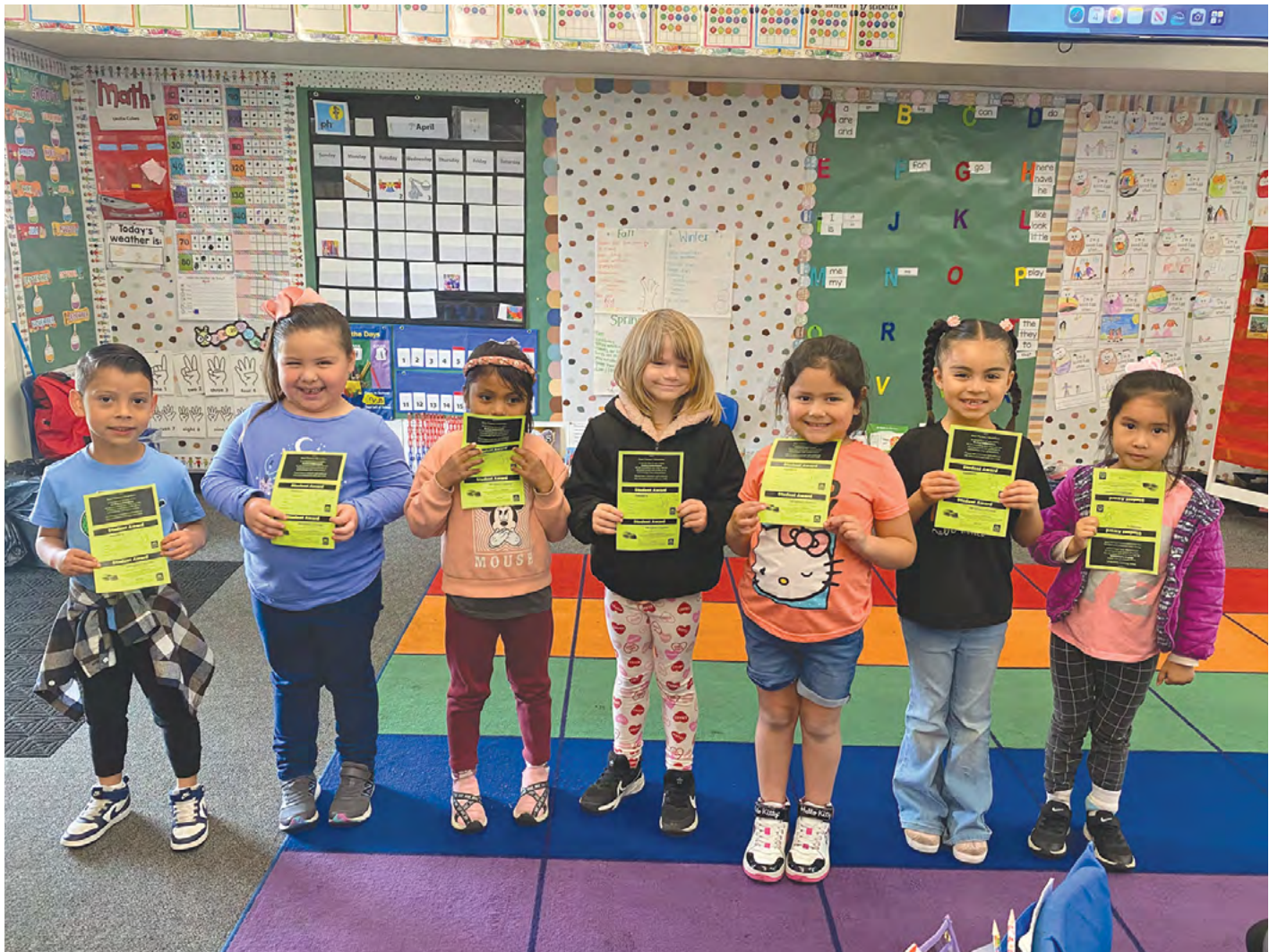
Congratulations to these students who received perfect attendance. Felicitaciones a estos estudiantes que recibieron asistencia perfecta.

teníamos un poco menos de 100 estudiantes con asistencia perfecta, pero para marzo, el número aumentó a 195 estudiantes con asistencia perfecta. También estamos muy orgullosos del trabajo de nuestro personal para involucrar y apoyar a nuestros estudiantes y familias para superar algunas de los obstáculos y mejorar la asistencia diaria general de nuestra escuela.