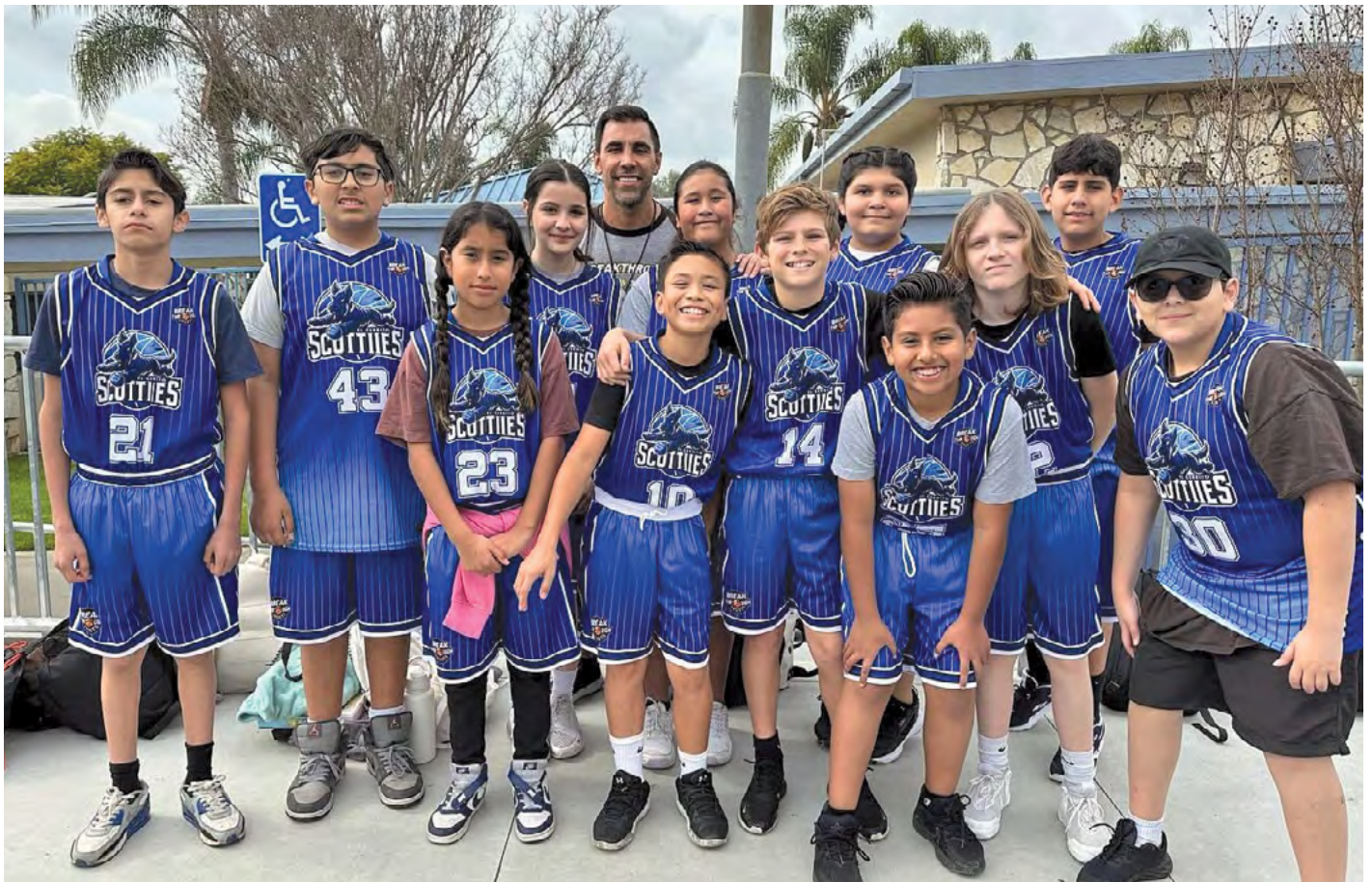
El Cerrito Basketball team members and their coach. Miembros del equipo de baloncesto de El Cerrito y su entrenador.

Nuevo en nuestra programación ELOP este año escolar son los deportes siendo competitivos después de la escuela, el primer deporte el baloncesto. Los equipos de todas las escuelas primarias participaron en prácticas y juegos semanales y la temporada concluyó con un torneo a nivel de distrito. Ahora que ha concluido la temporada de baloncesto, nuestro próximo deporte, el fútbol, está en marcha.