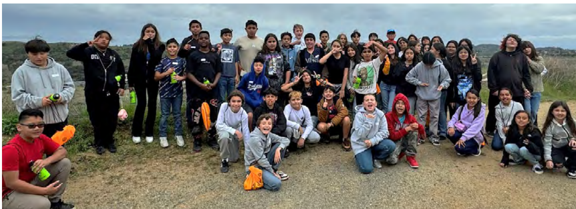
Exploring the Wonders of Nature: Students Attend 6th Grade Science Camp Explorando las Maravillas de la Naturaleza: Los Estudiantes Asisten al Campamento de Ciencias de 6to Grado

desarrollo personal. A medida que los estudiantes regresan a casa con nuevos conocimientos, recuerdos y amistades, llevan consigo las semillas de la curiosidad y una apreciación más profunda por las maravillas del mundo natural.