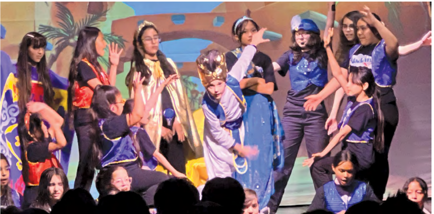
The Aladdin cast performing "Prince Ali" from Aladdin Kids. El elenco de Aladdin interpretando "Príncipe Ali" de Aladdin Kids.

¡Todos los estudiantes de Arbolita participaron en la decoración de nuestra sala multiusos para adaptar nuestro tema de "La Lectura Te Lleva a un Mundo Totalmente Nuevo" para la Semana de la Lectura en América! ¡El espacio se transformó en un mundo mágico con alfombras mágicas, lámparas, fotos del elenco, horizontes de Agrabah, linternas colgantes, linternas encendidas y mucho más! ¡Nuestros invitados caminaron sobre la alfombra roja, pasaron por cuerdas de terciopelo, bajo un arco de globos y a través de cortinas negras hacia nuestro mundo completamente nuevo! ¡Realmente fue una experiencia mágica para todos los que asistieron, y estamos emocionados de ver qué musical de Disney realizaremos el próximo año!