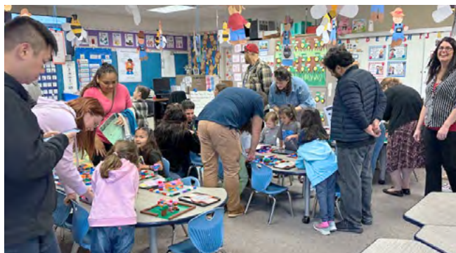
El Cerrito families visit classrooms to learn about our Code to the Future Showcase Las familias de El Cerrito visitan las aulas para aprender sobre nuestra Exhibición de "Code to the Future".

Recientemente organizamos un Baile de Luau para familias y estudiantes en los grados 3 a 6. El evento incluyó baile, un fotomatón y refrescos. También patrocinamos Almuerzo con un Ser Querido, el Baile de Cuentos de Hadas y el evento Leer a Través de América, que incluyó a miembros de la familia y miembros de la comunidad de La Habra como nuestros lectores invitados. Al involucrar a las familias en la educación de sus hijos, creamos una red de apoyo que refuerza el aprendizaje, fomenta un sentido de pertenencia y mejora el rendimiento estudiantil. En este entorno inclusivo y de apoyo, cada miembro de nuestra comunidad escolar desempeña un papel crucial en la formación de estudiantes seguros que estén preparados para el éxito en la escuela y más allá.