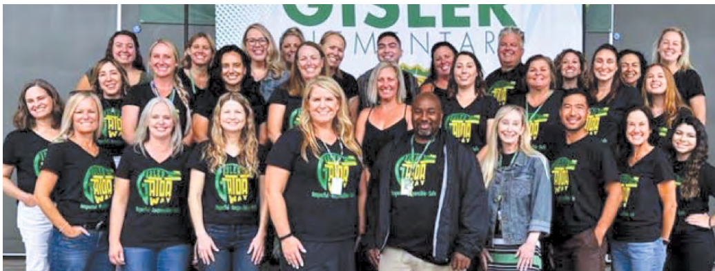
Hình Ảnh Nhân Viên