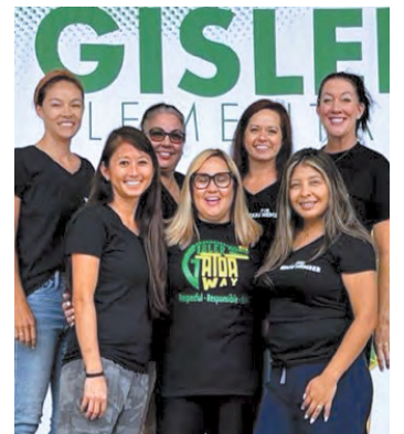
Hội Đồng PTO