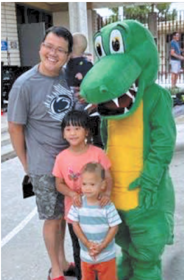
Gặp Gỡ & Giới Thiệu Mascot

Chào mừng trở lại với Gisler. Hãy làm cho năm nay trở nên đặc biệt!