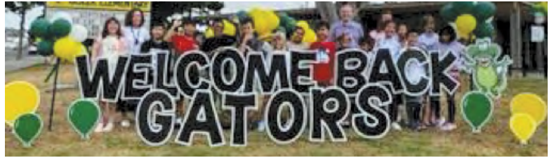
Hình Ảnh Chào Mừng Ngày Tựu Trường

Đối với học sinh của chúng tôi, các em là trái tim của trường chúng tôi. Sự tò mò và niềm đam mê của các em truyền năng lượng và sức sống vào trường lớp của chúng tôi. Chúng tôi ở đây để hỗ trợ các em từng bước trên con đường này.