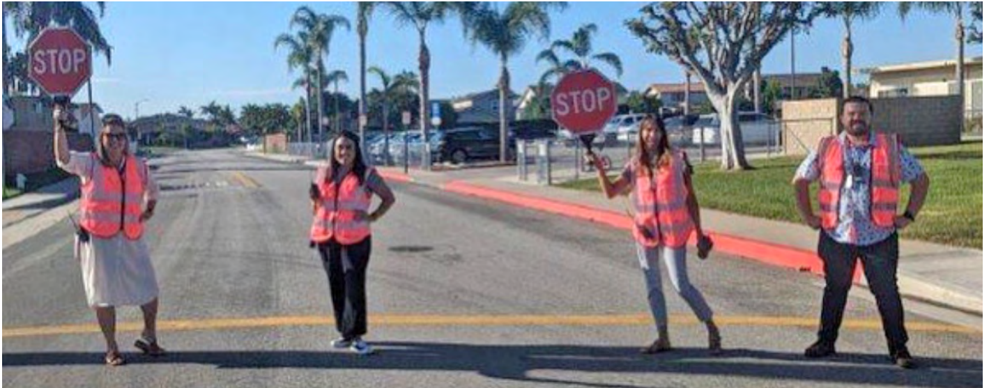
Tử tế với nhau. Hãy Ý Thức. Cẩn thận khi Băng qua Đường.