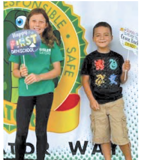
Ngày Đầu Tiên