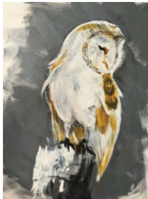
Artwork by Verose Deslonde