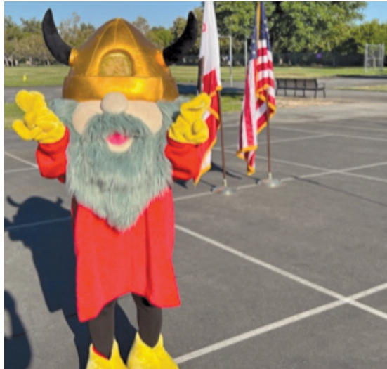
Vic prepares for his first Monday morning Assembly Vic se prepara para su primera Asamblea del lunes por la mañana

Una de las cosas más maravillosas de Valencia Valley es el sentido de comunidad que fomentamos. Este año, para incorporar a esa comunidad y para celebrar a nuestros estudiantes, estamos celebrando asambleas semanales en toda la escuela los lunes por la mañana. Cada asamblea comienza con un saludo a la bandera dirigido por un estudiante. Después, rendimos homenaje a grupos de alumnos y/o a individuos por sus contribuciones a nuestra comunidad. Algunos ejemplos de nuestras celebraciones incluyen lo siguiente: las clases ganan un peluche de Vic para la semana en honor a su comportamiento durante el almuerzo; reconoceremos las clases por su asistencia mensual; celebraremos a los individuos reconocidos en el Concurso de Reflexiones de la PTA. Las asambleas serán un momento para recordar a los estudiantes de los eventos escolares y las expectativas de toda la escuela también. Con el tiempo, aprenderemos la canción escolar de los años 80 para cantarla todos juntos, pero por ahora, terminamos con un grito de ánimo del colegio: ¡Valencia Valley, Valencia Valley, orgullo vikingo!